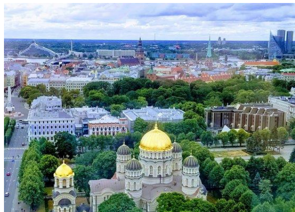
Sentrum i Riga