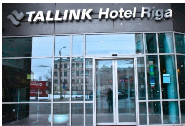
Vi bor hotell

De som har påmeldingene, må gi beskjed om glutenfri eller diabetes.